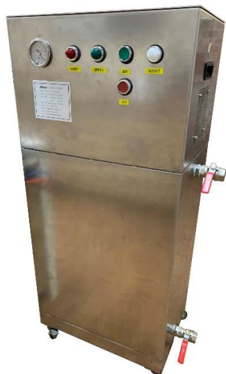
TSV-901 一代機 1.0