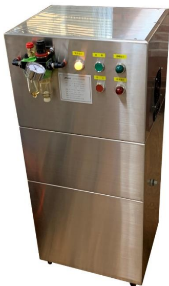
TSV-902 二代機 2.0